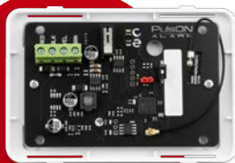
PulsON EXP-ZB(Zigbee) BOX

Moduł IoT ZigBee 3.0 do integracji centrali PulsON Alarm z urządzeniami smart home