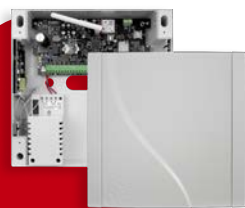
PulsON Alarm 2.0 4G PowerG PL

Plastikowa obudowa do central alarmowych z transformatorem i zabezpieczeniem antysabotażowym. Miejsce na akumulator 7Ah